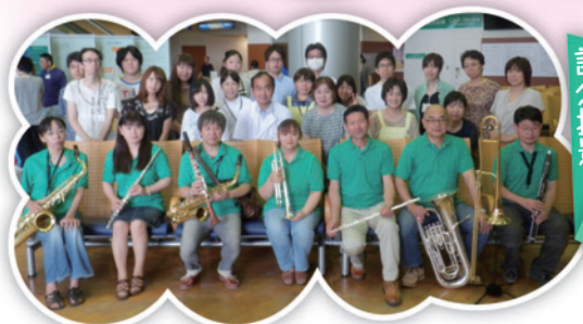
記念撮影のコンサート後