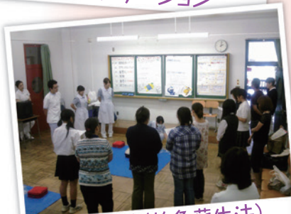
実習体験(救急蘇生法)