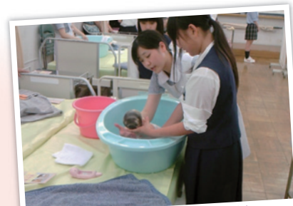
実習体験(沐浴体験)