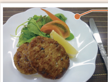
栄養価(1人分) エネルギー 380kcal たんぱく質23g 脂質30g 塩分1.1g