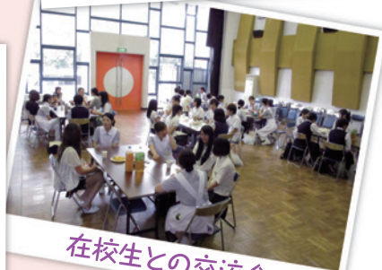
在校生との交流会