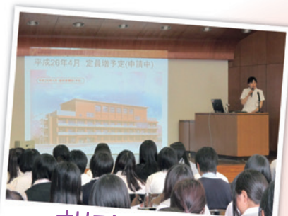
オリエンテーション

7月と8月に開催したオープンキャンパスは、2日間で148名の方に参加していただき、盛況のうちに終了いたしました。